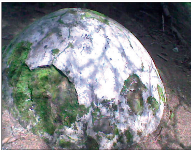
Bornă de frontieră pe o graniță nedreaptă-Groapa Seacă