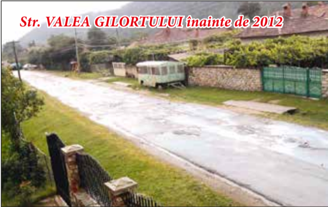
Str. VALEA GILORTULUI înainte de 2012

Am făcut tot ce mi-a stat în putință pentru ca să asigur buna gospodărire și funcționalitate a acestora, reabilitări, încălzire centrală, dotări, grupuri sanitare în interiorul obiectivelor, ridicarea unor construcții noi pentru asigurarea unei mai bune funcționalități a activității de învățământ școlar și preșcolar.