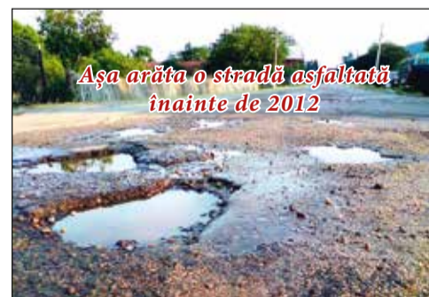
Așa arăta o stradă asfaltată înainte de 2012

din oraș. Cele asfaltate pline de gropi, cele neasfaltate, total degradate.