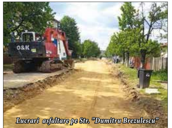
Lucrari asfaltare pe Str. „Dumitru Brezulescu”

Pot spune, chiar dacă se va considera că sunt lipsit de modestie, că odată cu alegerea mea în funcția de primar al orașului, Novaciul a început să miroase a oraș. Novăcenii sunt oameni care știu să aprecieze ceea ce am făcut pentru orașul nostru din 2012 până în prezent. Așa cum am mai precizat, sunt lucruri care se văd. Eu nu mă laud că voi face, eu chiar am făcut și voi face ce promit. Am demonstrat în cele două mandate.