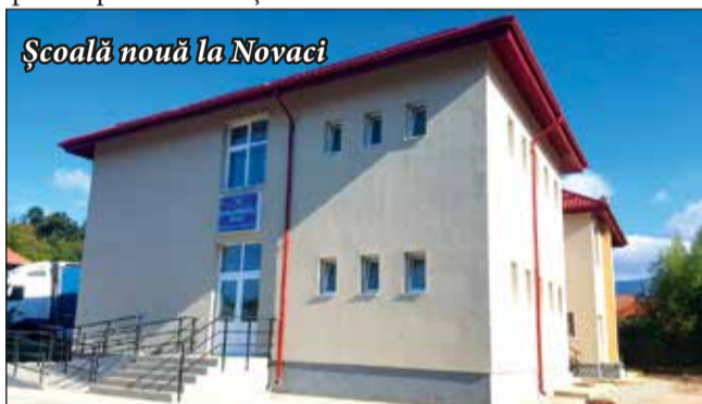
Școală nouă la Novaci

- D. L. Prioritățile activității mele și ale Primăriei orașului s-au îndreptat în ultima perioadă spre investiții în învățământ și educație: construcții noi de grădinițe, inclusiv cu program prelungit, școli, reabilitarea, dotarea și modernizarea celor existente pentru crearea unor condiții corespunzătoare pentru studiu și educație. Învățământul și educația vor rămâne în centrul preocupărilor mele și în viitorul mandat.